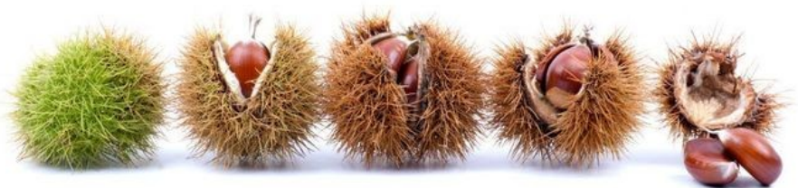
DES BOGUES DE CHÂTAIGNES